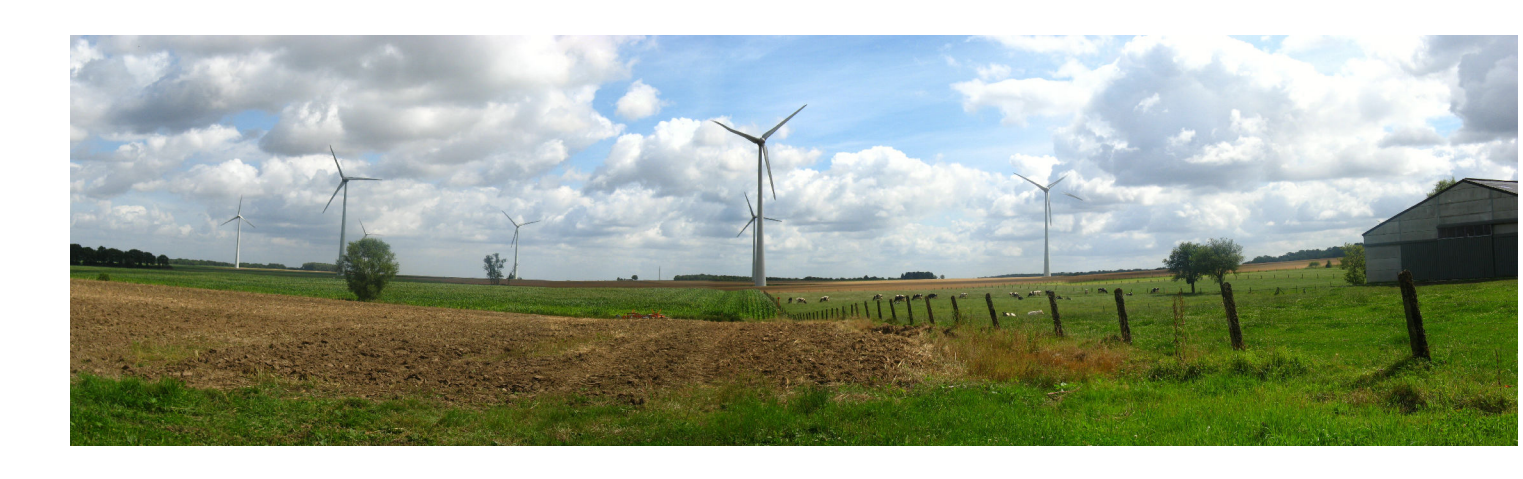
Eoliennes à Mettet